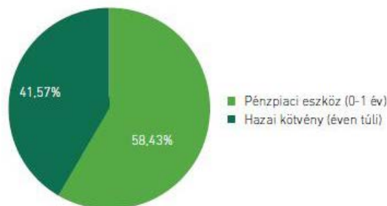
A portfólió összetétele 2016. december 30.